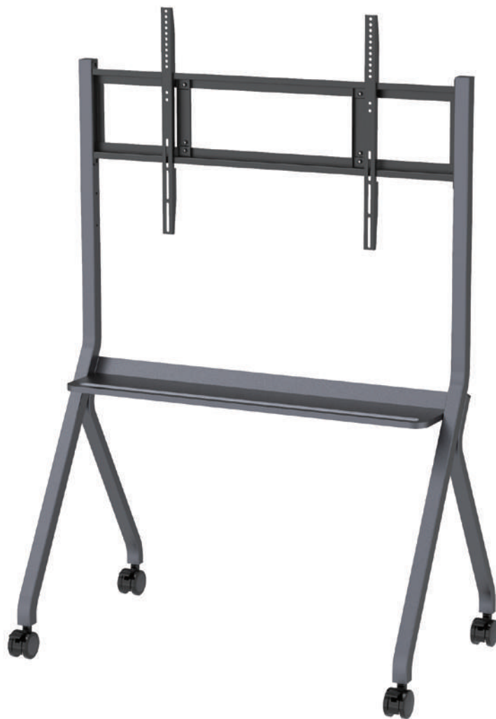
移動式ディスプレイスタンド